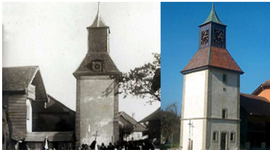
Le Turlet d'hier et d'aujourd'hui

Bonne chance à tous pour ce nouveau concours !